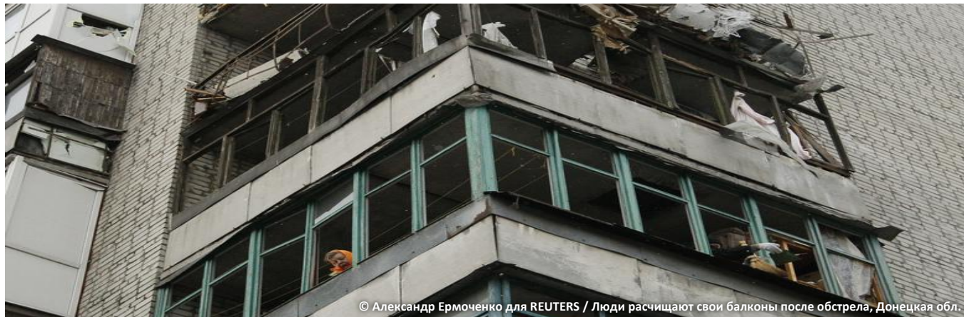
Люди расчищают свои балконы после обстрела, Донецкая обл.

В КЛАСТЕР ПО ВОПРОСАМ ЗАЩИТЫ ВХОДЯТ СУБКЛАСТЕРЫ ПО ВОПРОСАМ ЗАЩИТЫ ДЕТЕЙ, ГЕНДЕРНО-ОБУСЛОВЛЕННОГО НАСИЛИЯ И ПРОТИВОМИННОЙ ДЕЯТЕЛЬНОСТИ