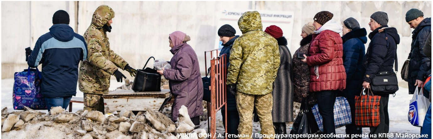
Процедура перевірки особистих речей на КПВВ Майорське