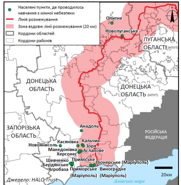
Населені пункти, де HALO Trust проводив навчання з мінної небезпеки у лютому 2019 року