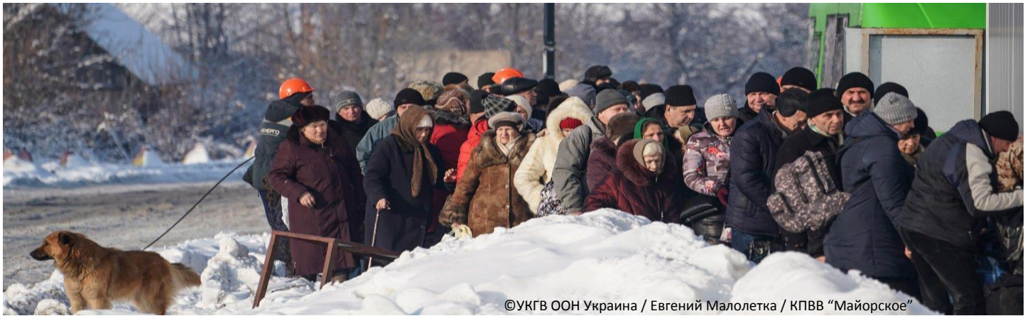
©УКГВ ООН Украина / Евгений Малолетка / КПВВ "Майорское"

В КЛАСТЕР ПО ВОПРОСАМ ЗАЩИТЫ ВХОДЯТ СУБКЛАСТЕРЫ ПО ВОПРОСАМ ЗАЩИТЫ ДЕТЕЙ, ГЕНДЕРНО-ОБУСЛОВЛЕННОГО НАСИЛИЯ И ПРОТИВОМИННОЙ ДЕЯТЕЛЬНОСТИ