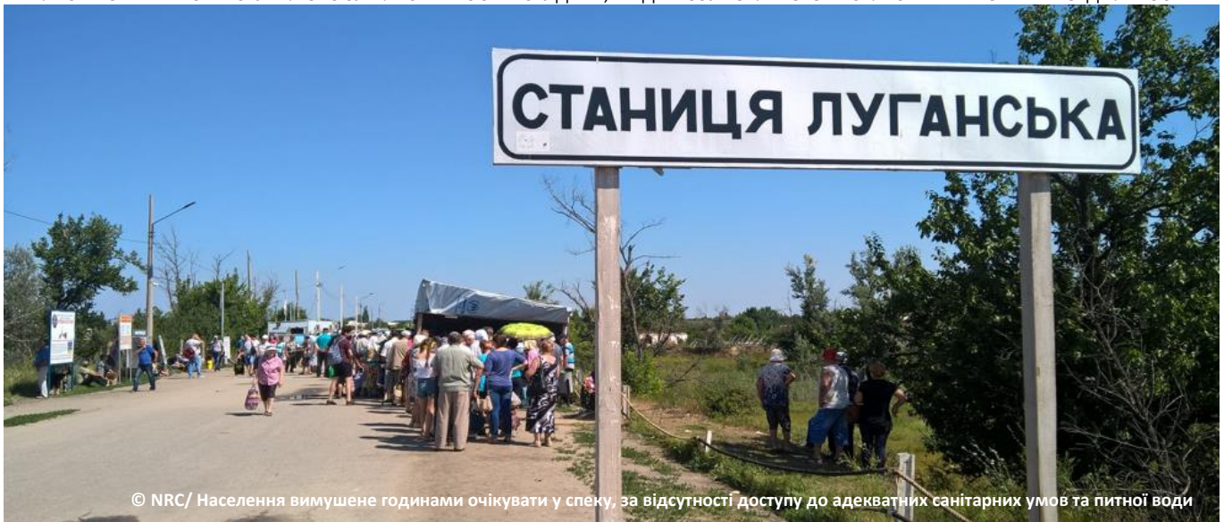
Населення вимушене годинами очікувати у спеку, за відсутності доступу до адекватних санітарних умов та питної води