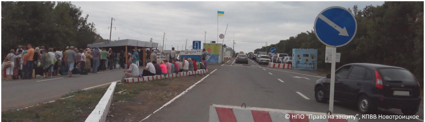
© НПО "Право на защиту", КПВВ Новотроицкое

КЛАСТЕР ПО ВОПРОСАМ ЗАЩИТЫ ВКЛЮЧАЕТ СУБ КЛАСТЕРЫ ПО ВОПРОСАМ ЗАЩИТЫ ДЕТЕЙ, ГЕНДЕРНОГО НАСИЛИЯ И РАЗМИНИРОВАНИЯ