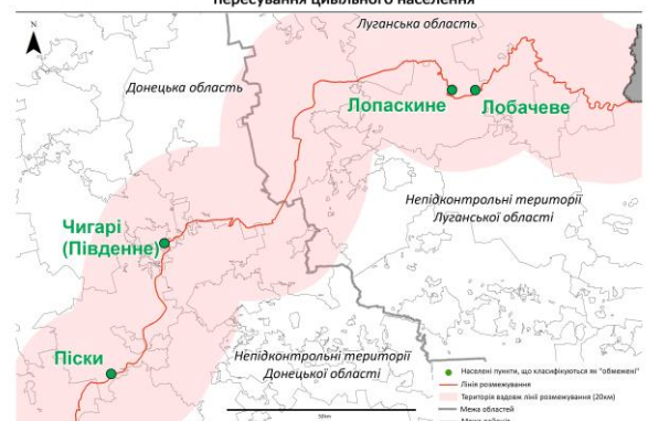
Населені пункти, в яких діють обмеження свободи пересування цивільного населення