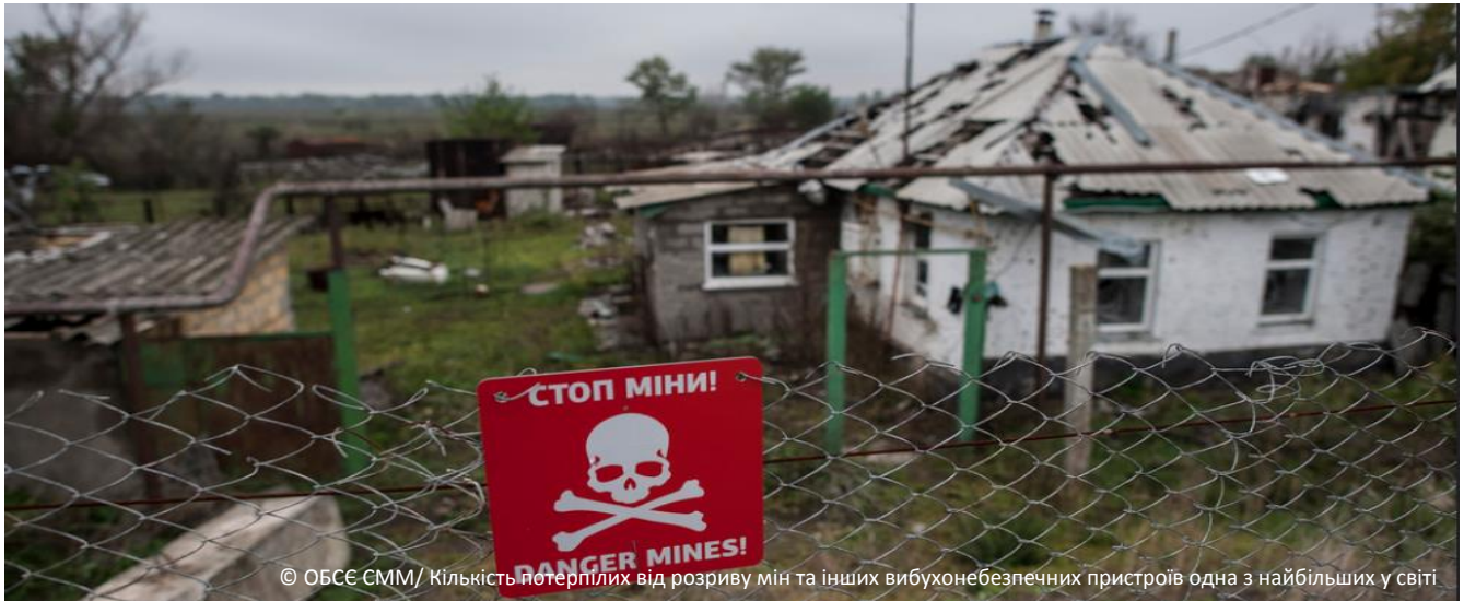
Кількість потерпілих від розриву мін та інших вибухонебезпечних пристроїв одна з найбільших у світі

КЛАСТЕР З ПИТАНЬ ЗАХИСТУ ВКЛЮЧЕ СУБКЛАСТЕРИ З ПИТАНЬ ЗАХИСТУ ДІТЕЙ, ГЕНДЕНОЗУМОВЛЕНОГО НАСИЛЬСТВА ТА ПРОТИМІННОЇ ДІЯЛЬНОСТІ