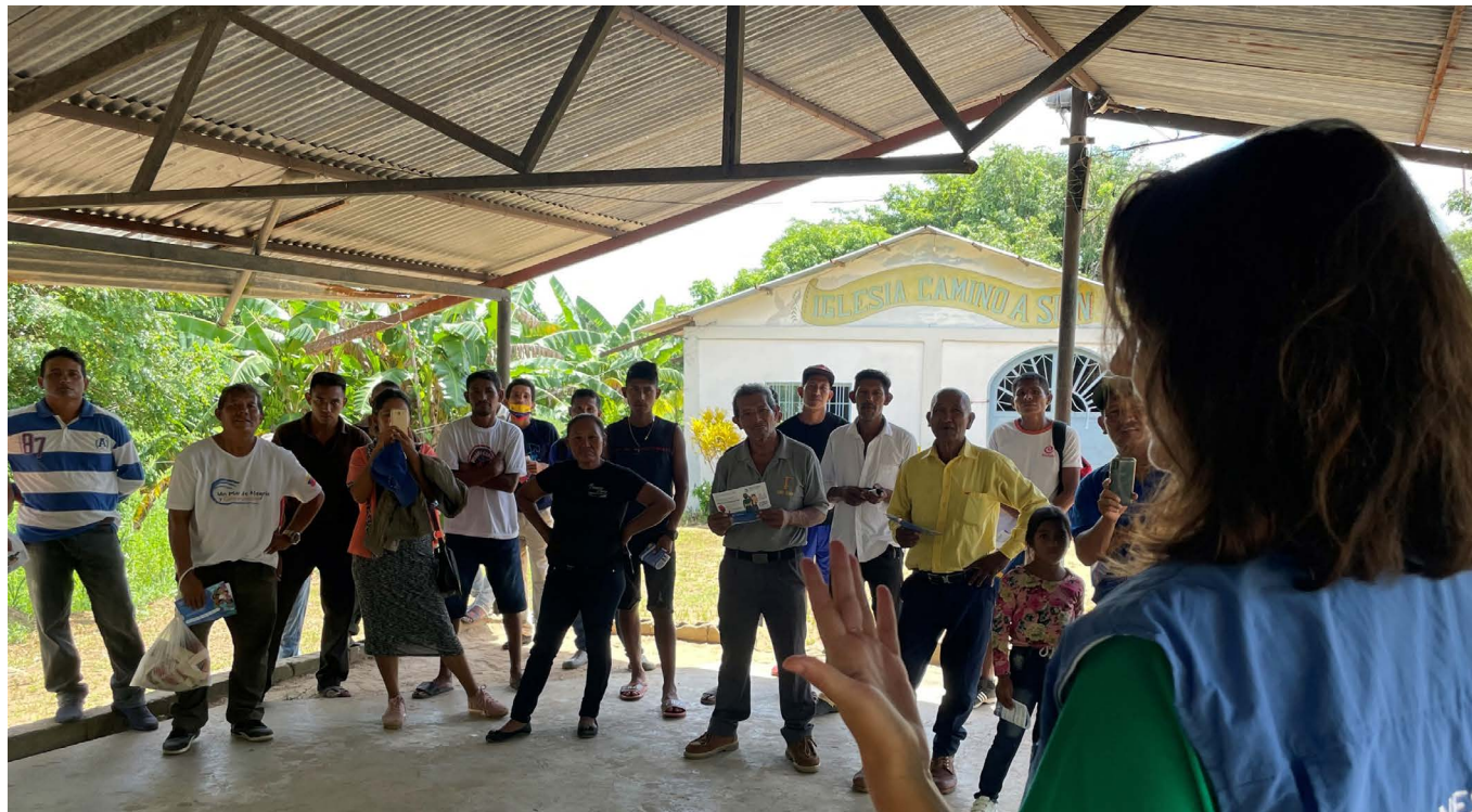
Sesión sobre canales de denuncia de PEAS en Delta Amacuro.

la comunidad por la organización, incluyendo grupos focales de discusión, comités, brigadas, entrevistas a personas clave, incluyendo líderes comunitarias.