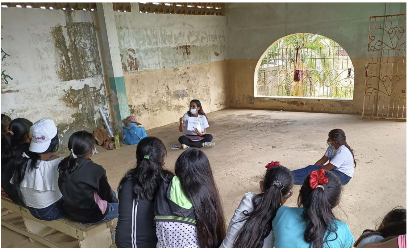
Grupo focal en comunidad Wayuu, en el estado Zulia.

Personas que participan en procesos de diseño, implementación, monitoreo y evaluación de las actividades humanitarias ejecutadas en