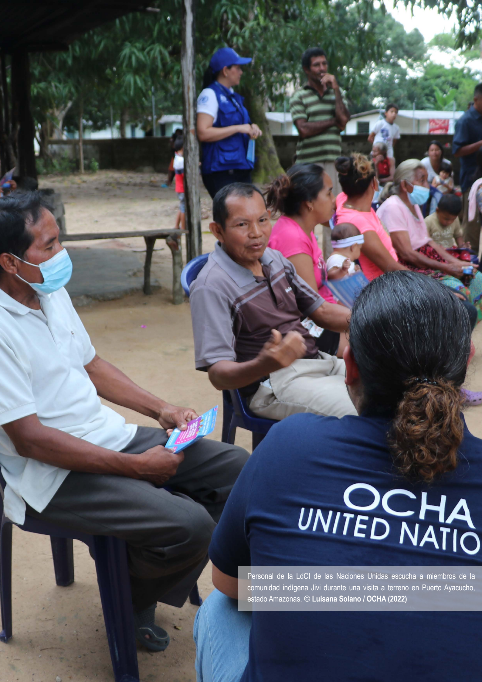
Personal de la LdCI de las Naciones Unidas escucha a miembros de la comunidad indígena Jivi durante una visita a terreno en Puerto Ayacucho, estado Amazonas.