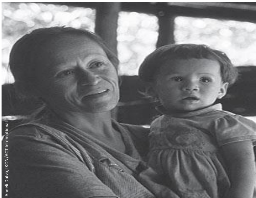
Desplazados internos en Colombia.

y otros indicadores clave para que se puedan tener en cuenta las necesidades específicas de grupos particulares de desplazados internos. Se debe prestar atención a las diferentes causas de desplazamiento. Más aun, se necesita información no solo sobre los desplazados internos en situaciones de emergencia, sino también sobre aquellos que están en situaciones de desplazamiento prolongado. Cabe señalar que la recolección de datos y los procesos de registro de ninguna manera deben poner en riesgo la seguridad de los desplazados ni afectar su derecho legal de gozar de la protección y asistencia de su gobierno.