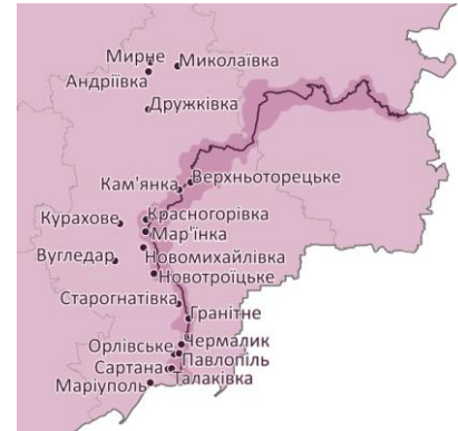
Локації кімнат із психосоціальної допомоги, відкритих DRC