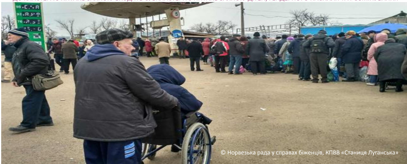
© Норвезька рада у справах біженців, КПВВ «Станиця Луганська»

ДО КЛАСТЕРА З ПИТАНЬ ЗАХИСТУ ВХОДЯТЬ СУБКЛАСТЕРИ З ПИТАНЬ ЗАХИСТУ ДІТЕЙ, ГЕНДЕРНОГО НАСИЛЛЯ ТА РОЗМІНУВАННЯ